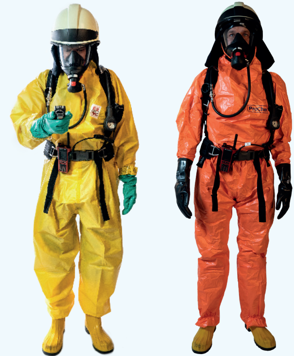
Einwegschutzanzüge für A-, B- und C-Einsätze