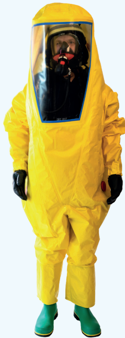
Für den begrenzten Einsatz (geringere mechanische Anforderungen)