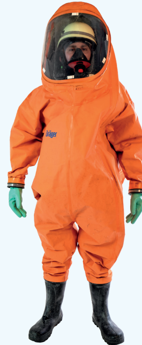
Wiederverwendbare CSA (höhere mechanische Anforderungen)