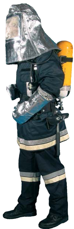
Form I Haube und Handschuhe