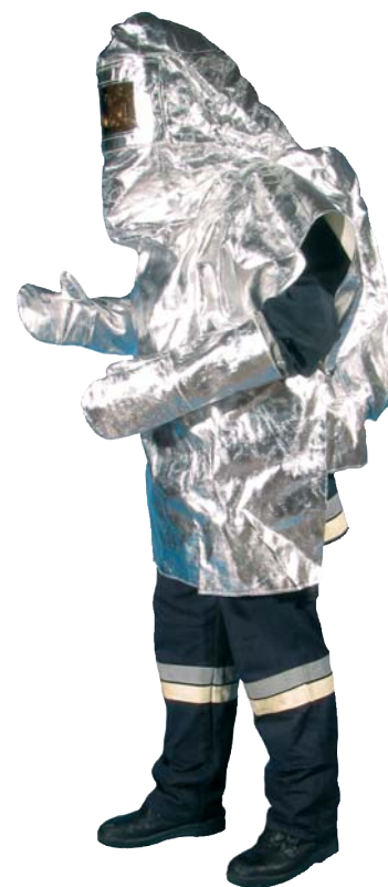
Form III Anzug einteilig oder zweiteilig