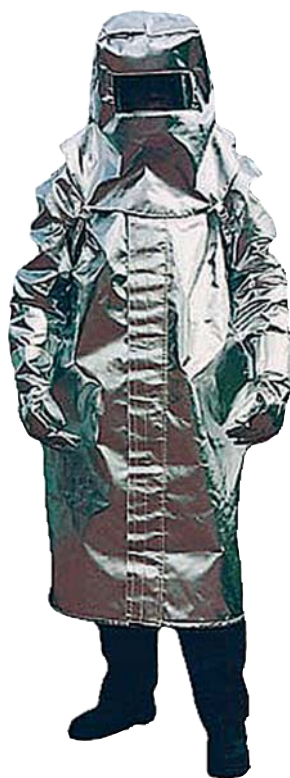
Form II Mantel oder Umhang