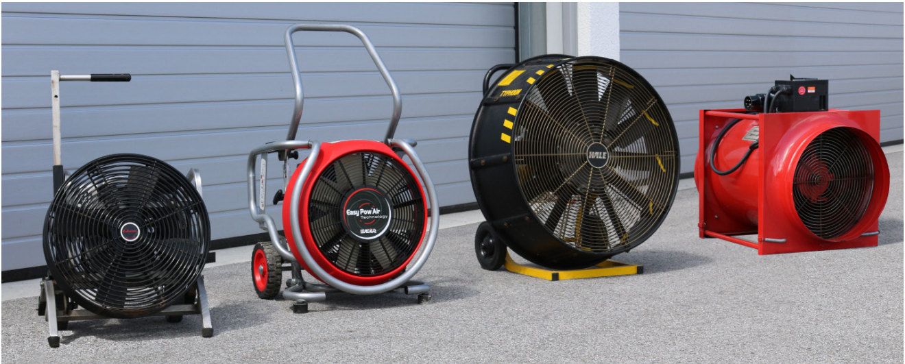
Injektor- bzw. Turbolüfter, Hochleistungslüfter, Propellerlüfter, Be- und Entlüftungsgerät

Das Be- und Entlüftungsgerät kann – wie der Name schon sagt – als Zweiwege-System eingesetzt werden, um Luft einzubringen oder abzusaugen. Mit Hilfe der dazugehörigen Sauggluten können auch schwer zugängliche Bereiche (z. B. Keller von außen über Lichtschächte) erreicht werden. Das Be- und Entlüftungsgerät ist serienmäßig EX-geschützt und benötigt daher auch einen Leitungsroller mit einem speziellen Stecker. Die Leistungsfähigkeit im Schubbetrieb ist im Vergleich zu den voran genannten Belüftungsgeräten eher als gering einzustufen.