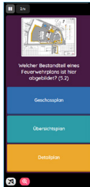
rechts: Ansicht von Frage / Antwort im Quiz auf dem Endgerät (Smartphone) des Teilnehmers

In diesem Beispiel kann als Arbeitshilfe ein Merkblatt verwendet werden. In der Fragestellung gibt die Anmerkung „(5.2)“ den Hinweis, dass die Antwort im entsprechenden Kapitel zu finden ist. sind sowohl PC, Tablet als auch Smartphone nutzbar.