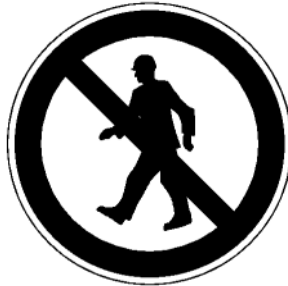
P03 Für Fußgänger verboten

Diese Forderung ist z.B. erfüllt, wenn Aufstiege an den Denneebäumen gesperrt sind und die Absperrung durch das Verbotsschild P 03 „Für Fußgänger verboten“ nach Anlage 2 der UVV „Sicherheits- und Gesundheitsschutzkennzeichnung am Arbeitsplatz“ (GUV-V A 8, bisher GUV 0.7) gekennzeichnet ist.